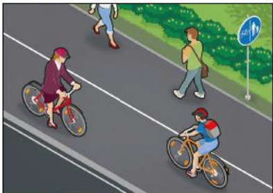
Jalankulkijoille ja pyöräilijöille on liikennemerkeillä osoitettu omat puoliskonsa. Pyöräilijät ajavat oman puolensa oikeassa reunassa.