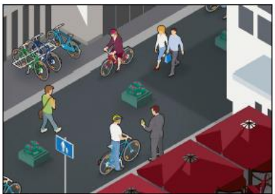
Kävelykadulla pyöräilijän on sovitettava ajonopetensa jalankulun mukaiseksi ja annettava kävelijöille esteetön kulun.