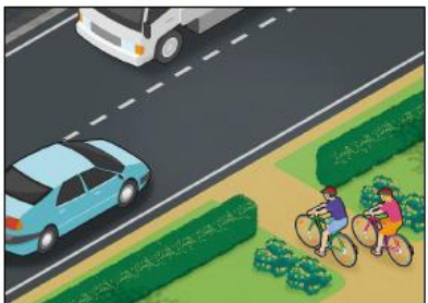
Väistä muita aina, kun tulet tielle pihasta, pihakadulta tai muusta vastaavasta paikasta.