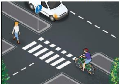
Opettele liikennesäännöt. Varmista aina, että muut tien käyttäjät ovat huomanneet sinut.