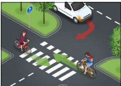
Kääntyvän autoilijan on väistettävä risteävää tietä ylittävää kävelijää ja pyöräilijää. Varmista, että autoilija on havainnut sinut.