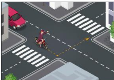
Käänny oikein. Vasemmalle kääntyminen on vaarallisia tilanteita ajoradalla pyöräillessä. Turvallisin tapa on tehdä ns. suorakulmakäännös.