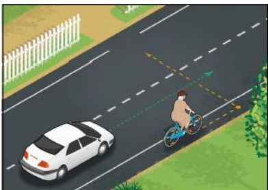
Älä käänny yllättäen autoilijan eteen. Näytä suuntamerkki ja tarkkaile takaa tulevia. Pysähdy tarvittaessa.