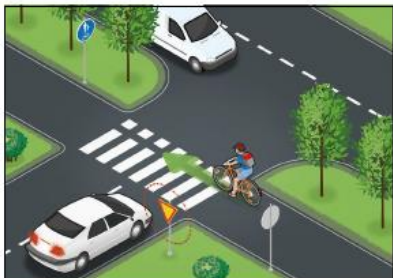
Liikennemerkeillä ajojärjestystä voidaan muuttaa. Kärkkölmion suunnasta tuleva autoilija väistää myös pyörätieellä ajavia.