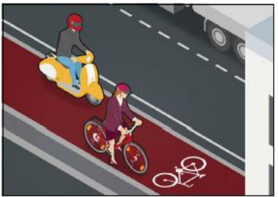
Ellei pyörätietä ole, pyöräilijä ajaa pientareella tai ajoradan oikeassa reunassa. Pyöräkaistalla pyöräilijä noudattaa samoja sääntöjä kuin ajoradan reunassa ajaessaan.