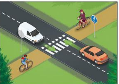
Pyörätieltä tuleva pyöräilijä saa ajaa tien yli pyörätien jatketta pitkin, mutta hänen on väistettävä sekä oikealta että vasemmalta tulevia autoilijoita.