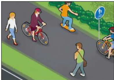
Jalankulkijat kulkevat oikeassa tai vasemmassa reunassa. Pyöräilijät ajavat oikeassa reunassa.