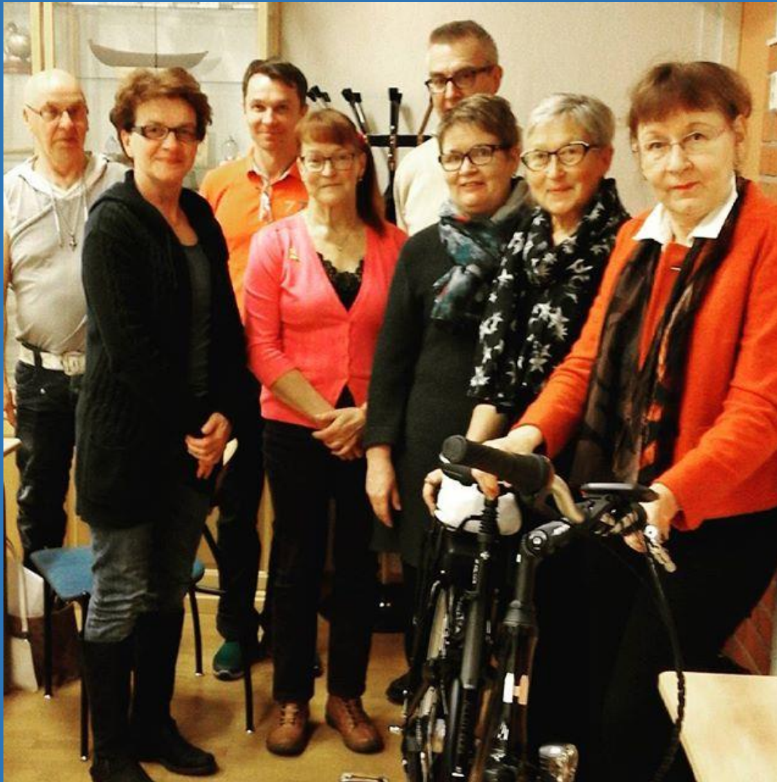
Iisalmi liikkuu viksusti –kilometrikisan palkintona oli sähköavusteinen polkupyörä.