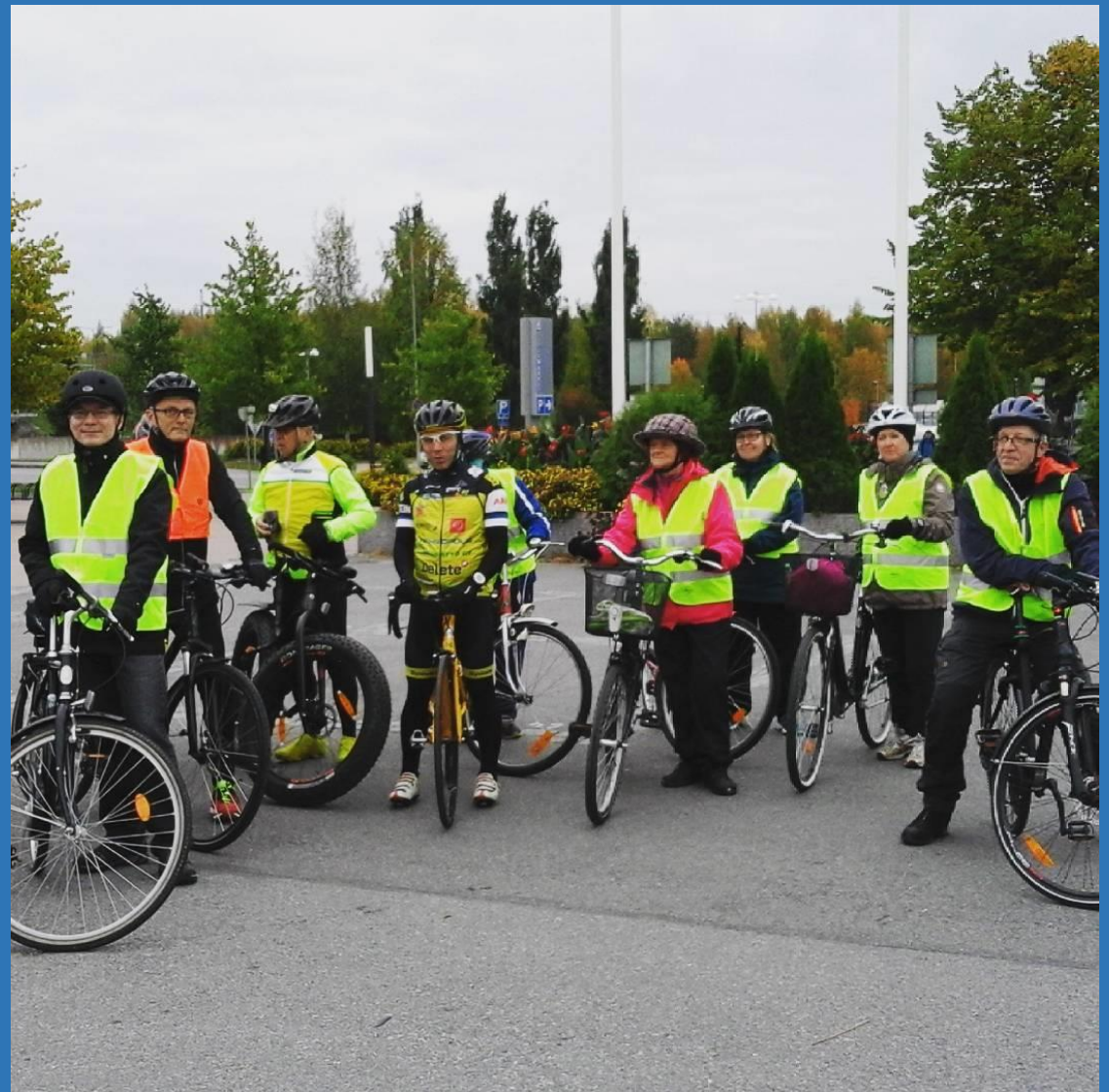
lisalmen kaavapyöräily syyskuussa 2016. Virkamiehet ja kaupunkilaiset pyöräilivät yhdessä ja reitin turvallisuudesta ja mukavuudesta annettiin palautetta. Leveitä pientareita, kiitos!