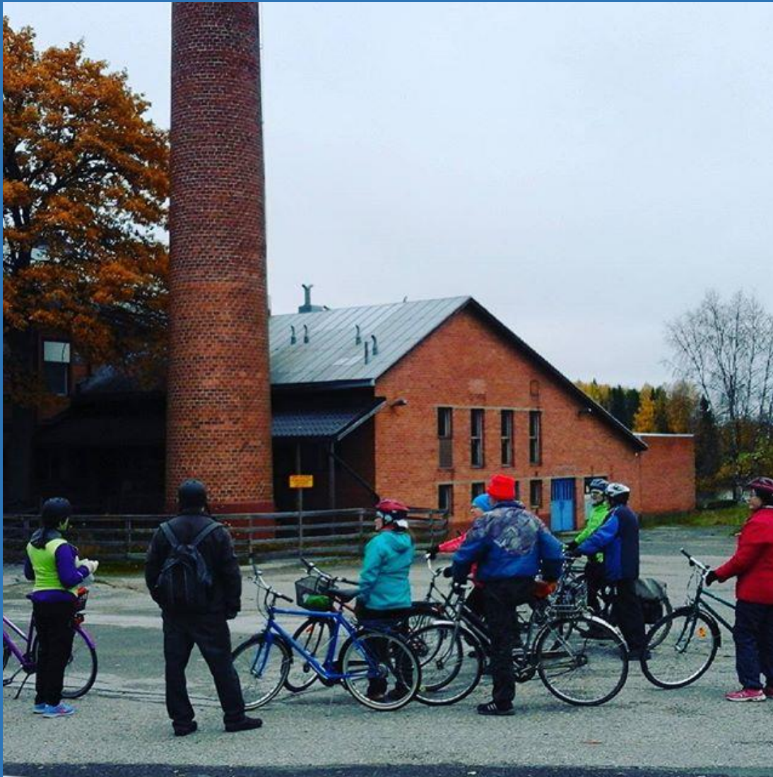
Kulttuuripyöräily Kiuruvedellä 7.10.2017.