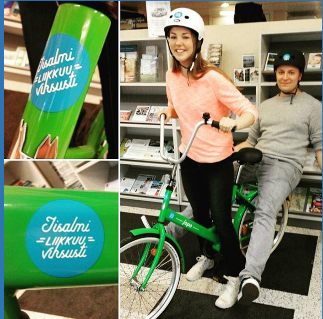
Iisalmen kaupungin matkailuneuvojat kesä 2016. Vihreä Jopo on myös asiointipyörä.