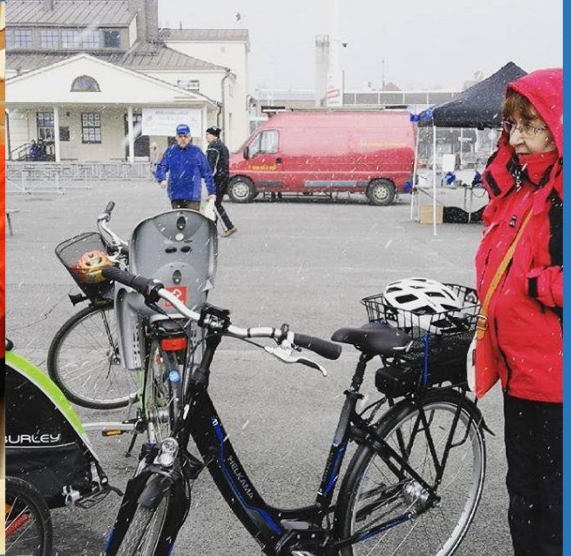
Verkostoitumista: sama pyörä oli esillä hankkeiden esittelypäivässä Iisalmen torilla 9.5.2017.