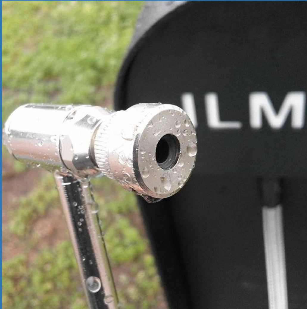
Iisalmi lisäsi vuonna 2016 runkolukittavia telineitä ja torille kaikkien yhteisen ilmapumpun.