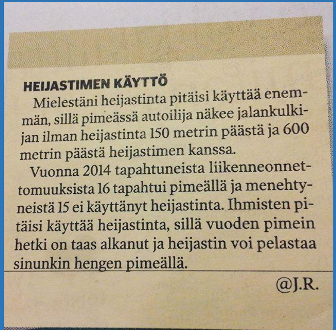
Mediakeskustelun seuranta. Yleisönosastokirjoitus Iisalmen Sanomissa syksyllä 2016.