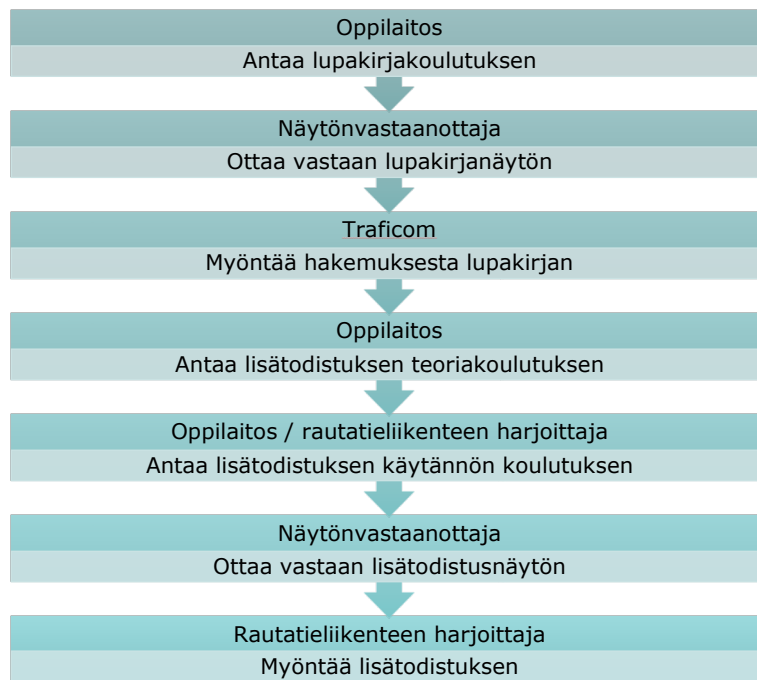
Kuva 1. Kuljettajakelpoisuuden saavuttaminen ja eri toimijoiden roolit.

Lisätodistuskoulutuksen vaiheet voidaan toteuttaa peräkkäin tai samanaikaisesti rautatieliikenteen harjoittajan ja oppilaitoksen yhdessä sopiman mukaisesti. Lupakirjan ja lisätodistuksen teoriakoulutus voidaan toteuttaa osittain tai kokonaan samanaikaisesti riippuen oppilaitoksen koulutusohjelmasta.